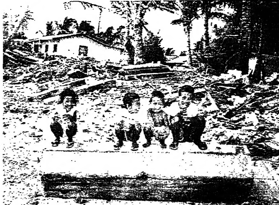
اولاد يلهون بين القبور التي يعثرها العاصفة مؤخرا على شاطئء ماجورو. عاصمة جزر المارشال غربى المحيط الهادىء . ماجورو (جزر المارشال) - ر

يلعب اطفال حفلة اسفل اشجار جوز الهند على شاطئء ملىء بالمقلمة العفنة والحطام وميثاق السيارات الصلبة . وتتشر في المكان علب البيرة الفارغة وحطوم اسراب الذباب فوق الرمال .